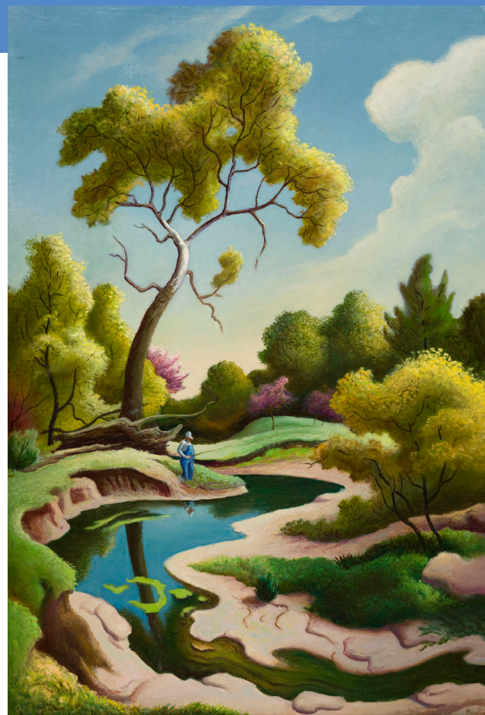
Creación de Arte Comunitario : América 250

El proyecto Community Created cuenta con el apoyo del Museo de Bellas Artes de Arkansas y de la Fundación Alice L. Walton.